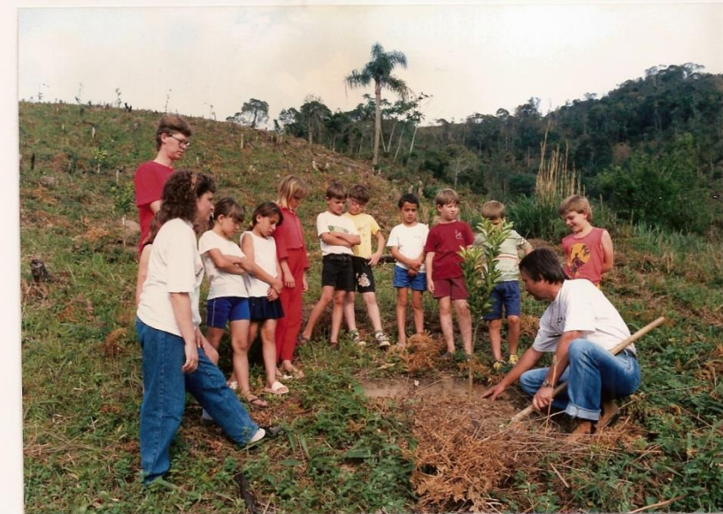
Por amor a Angelina