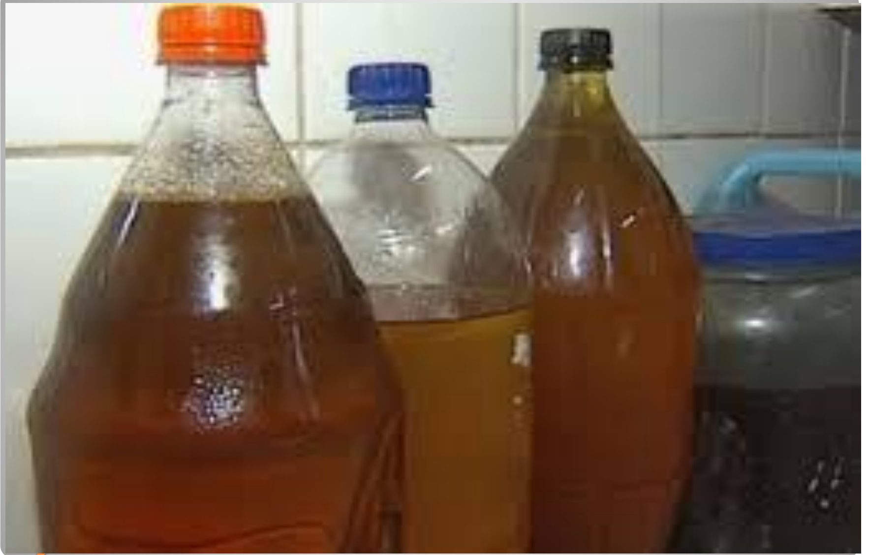
Óleo de cozinha