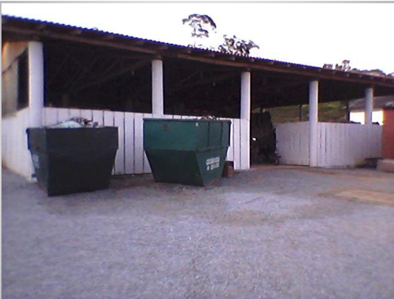
CENTRO DE TRIAGEM