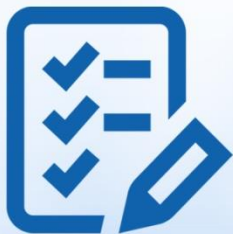
Plano de Gerenciamento